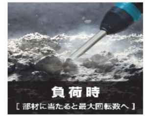
負荷時 [部材に当たると最大回転数へ]