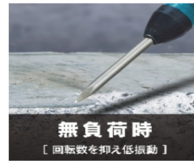
無負荷時 [回転数を抑え低振動]