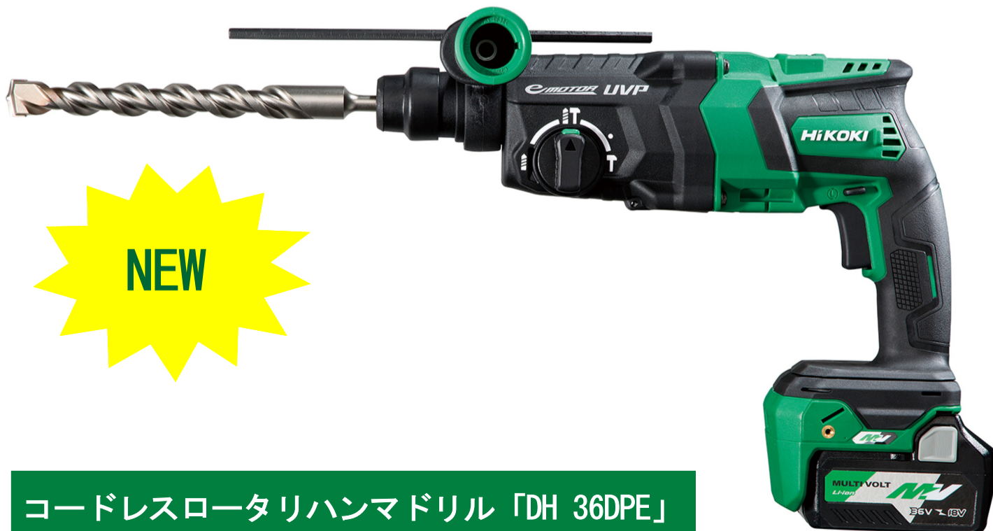
コードレスロータリハンマドリル「DH 36DPE」

「DH 36DPE(NN)」 49,000円(税別)。 ※蓄電池・充電器・ケース別売。 オプション品の集じんシステムは、15,000円(税別)。 ※DH 36DPF(2XP)は標準付属。 ※2頁に続く