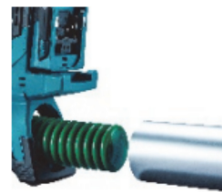
カートリッジで充填