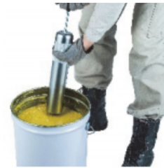
ペール缶から バレルへ直接充填