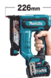
質量 2.3kg (BL4025 装着時)