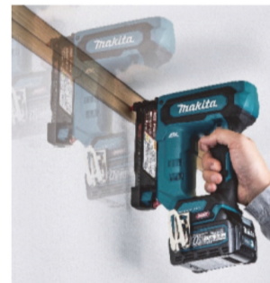
低反動+コンタクトアーム方式で安定した引きずり打ち