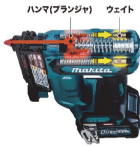
低反動機構 (カウンターウェイト方式)