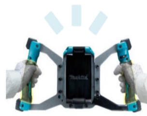
ダブルハンドル&握りやすいグリップ

「UT001G」は、様々な材料に合わせたカクハン作業を可能にする。機械式2段変速と5段階のダイヤル変速を組み合わせることにより、細かな回転数調整を可能にする。これにより、モルタルや塗料等の中粘度材をはじめ、コンクリート等の高粘度材など、さまざまな材料に合わせた最適なカクハンを実現する。