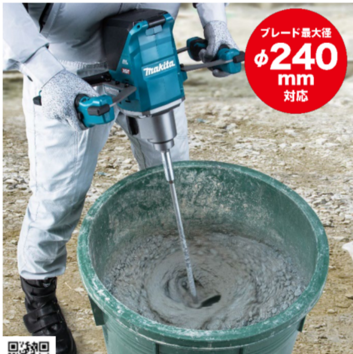
【低速モード】 0~500 min -1 高粘度材 【コンクリート等】 ※低速モードで長時間の作業が可能