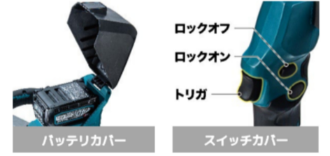
バッテリーカバー