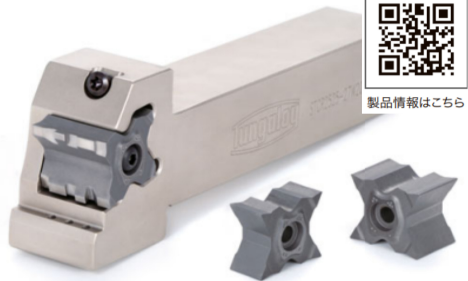
製品情報はこちら

ねじを締付けることで、ピンを押し下げ、ピンが下側へ移動し、インサートを最適な位置に固定。4点でインサートを強固に固定し、切削力によるねじの緩みを防止する剛性の高い新クランプ機構により、切削抵抗が大きくなる総形加工においてインサートを確実に保持する。