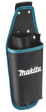
ホルスタ付 標準付属品