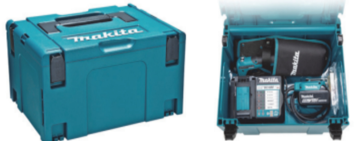
マックパックタイプ3 標準付属品 各種アイテムをまとめて収納可能 ※写真のバッテリー、充電器は別売です