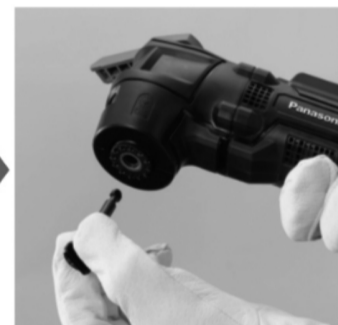
②固定ネジを取り外す