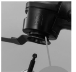
磁石になっているので ブレードの 仮置き可能