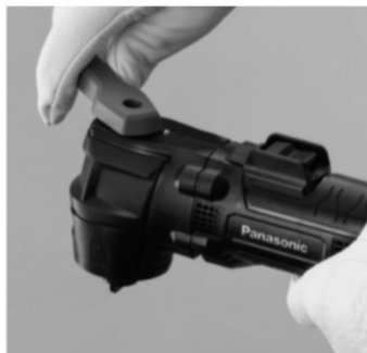
①ブレード着脱レバーを開く