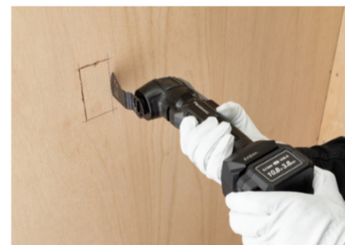
硬いコンパネの開口もパワフル