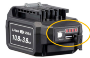
電池残量がわかる目盛付き

新製品は新3.8Ah電池搭載により、高いパフォーマンスを維持。従来の2.0Ah電池に比べ、作業量が必要な場面でも安心して使える高容量電池を搭載する。さらに、出力4WまでのUSB充電ポート付属により、電池単独としても使用することができる。