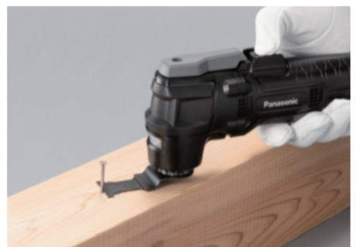
釘の切断もスピーディ

■電設資材商品相談窓口、問い合わせ先→ TEL 0120-878-082(受付月～土 9:00～18:00) ■電動工具 ホームページURL→ https://www2.panasonic.biz/jp/densetsu/powertool/ ■EXENA URL→ https://www2.panasonic.biz/jp/densetsu/powertool/exena/