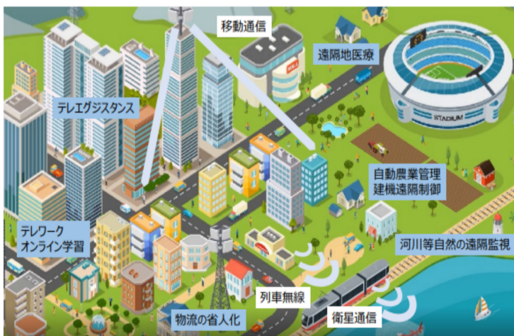
図2 通信インフラを支えるポスト5G通信のイメージ

また、湘南工科大学は、ポスト5G基地局における無線部の基礎研究を継続し、通信インフラを担う次世代の技術者の育成、産業の発展に貢献する。