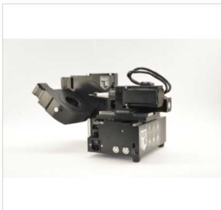
POCKET NC社 <卓上型5軸加工機:V2-10>

また、会期中は本展示会と並行して期間限定の特別キャンペーンも実施。卓上5軸加工機「V2-10」展示機を期間限定の特別価格で提供する。