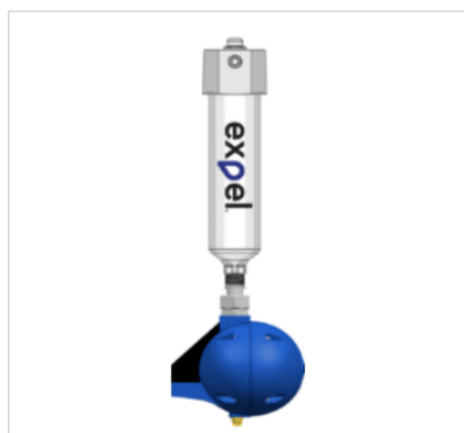
オリジナルAVG社 <高機能エアフィルター>