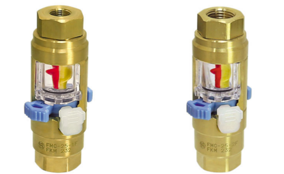
フローモニター 型式:FMC-25-1F

と比べ、形状が長さ方向で最大16%、直径は最大22%コンパクトになり、狭い箇所や小ピッチでの取付けが容易にできる。