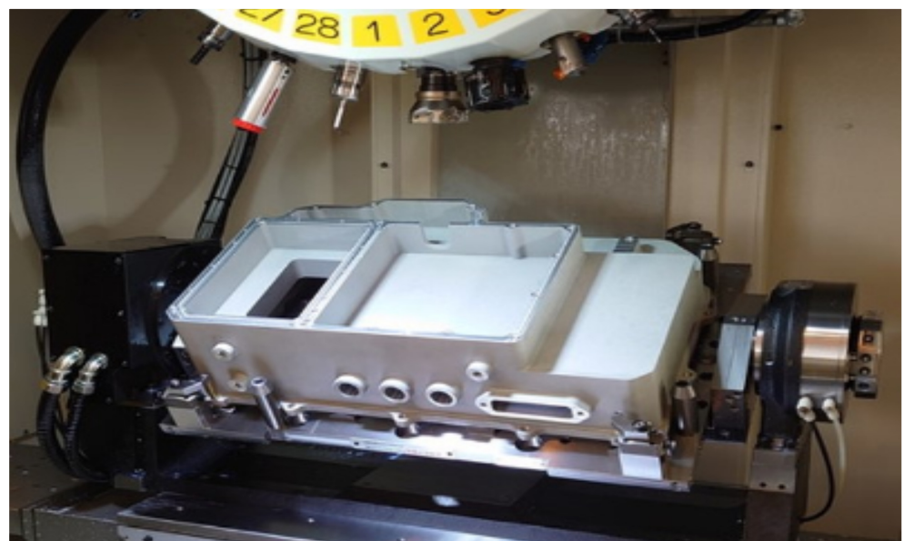
DDR-TLiB高上げ仕様を使用した加工事例

Z軸の早送り速度および加速度が従来より向上したほか、ロボットドリル独自の固定サイクル(Gコード)により、ドリル・タップや円加工、バリ取りの高速化に加え、テーブル積載重量設定の自動化や最新FA機能の適用により、さらなるサイクルタイム短縮を実現し