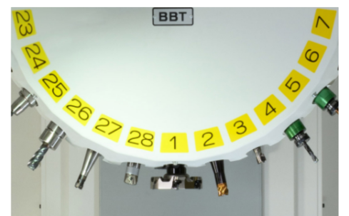
工具収納本数28本仕様タレット