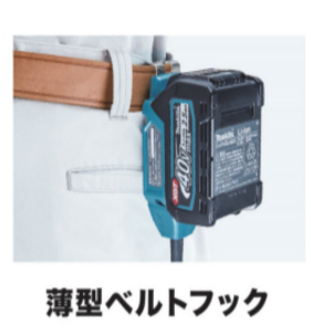
薄型ベルトフック