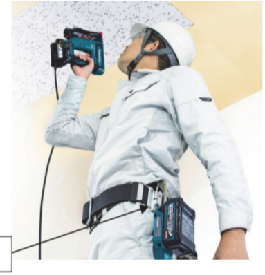
上向き作業も軽快