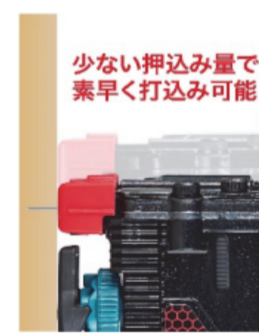
ショートストロークコンタクトアーム マイクロスイッチ搭載(電子式)