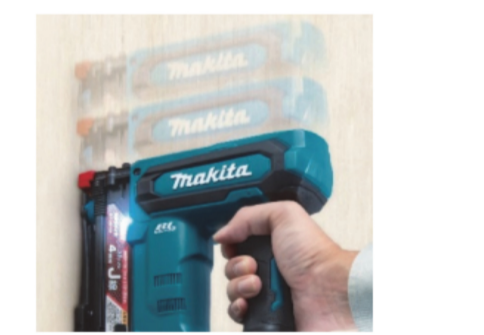
「引きずり打ち」や「振り打ち」も可能