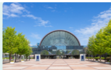
関西グランドフェア