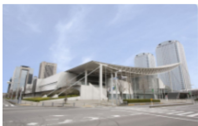
関東グランドフェア