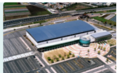
九州グランドフェア