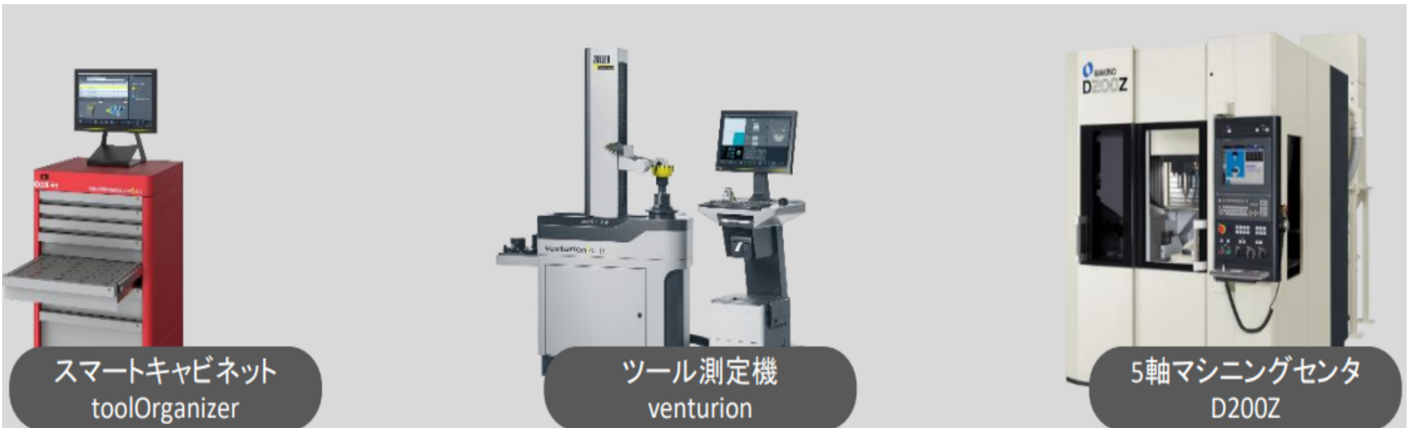
スマートキャビネット toolOrganizer