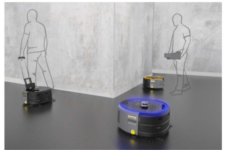
床清掃ロボット KIRA CV 50 (参考出展)

た需要が継続的に見込まれる反面、地域によっても異なるが、採用コストをかけ、賃金の見直しをしても人が集まらない、定着しない状態が恒常化し